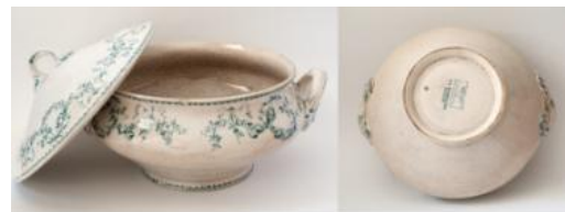
Kiểu HOA VĂN “MOZART” TRÊN ĐỒ SANGI U&C SARREGUEMINES DO LA BORDELAISE SAIGON ĐẶT HÀNG

Ngoài ra, trên một chiếc tách men đồ trắng trang trí hoa tulip cùng kiểu hoa văn “Fontange” do Công ty La Bordelaise – Saigon đặt hàng, nhưng dưới đáy món đồ không ghi kiểu thức hoa văn và