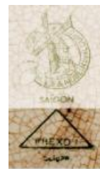
HIỆU ĐỀ 1: DỊ BẢN 4

+ Hiệu đề 2: cối xay gió có dáng hình tháp, bên dưới nở ra, đỉnh nhọn có 4 cánh quạt nằm ngay giữa sát đỉnh. Xen kẽ cánh quạt có các chữ: Trên cùng dòng chữ France, M ( Moulin ), D ( Des ), L ( Loups ) và chữ Hamage dưới cùng. Bên dưới cối xay gió là dòng chữ ghi tên “Hoa văn”. Hiệu đề này do lò Wandignies-Hamage sản xuất, in màu đen và lục