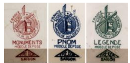
HIEU DE 1: DI BAN 1

+ Hiệu đề 1: Những món đồ này do lò Wandignies-Hamage sản xuất gồm có 4 bản khác nhau (dị bản).