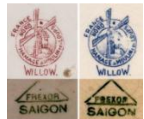
HIEU DE 1: DI BAN 2

. Dị bản 3: In màu đen. Hình thức hoàn toàn giống dị bản 2, nhưng khác ở vị trí chữ France. Bản này chữ France không nằm trên