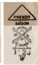
HIỆU ĐỀ 4

+ Hiệu đề 4: cối xay gió có dáng hình tháp, bên dưới nở ra, đỉnh nhọn có 4 cánh quạt nằm ngay giữa sát đỉnh. Xen kẽ cánh quạt có các chữ: Trên cùng dòng chữ France, M ( Moulin ), D ( Des ), L ( Loups ) và chữ Si-Amand dưới cùng. Bên dưới cối xay gió là dòng chữ ghi số kí hiệu “Hoa văn”. Hiệu đề này do lò Saint Amand sản xuất, in màu đen.