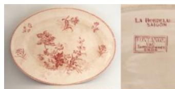
Kiểu HOA VĂN “FONTANGE” TRÊN ĐỒ SANGI U&C SARREGUEMINES DO LA BORDELAISE SAIGON ĐẶT HÀNG