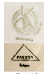
HIỆU ĐỀ 3